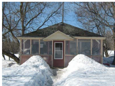
La maison des semis

Outils de jardin, outils pour travaux multiples, grosses boîtes de carton, des restes de tissus, coupes à vin, à desserts, grandes et petites assiettes en verre, bols à soupe, des tablettes, des étagères, une petite armoire étroite, des chaises à jardins, tables pliantes, pots en grès brisés ou en bon état, céramiques, paniers osier, pots à fleurs, gril-lages, clous, vis, moulures.